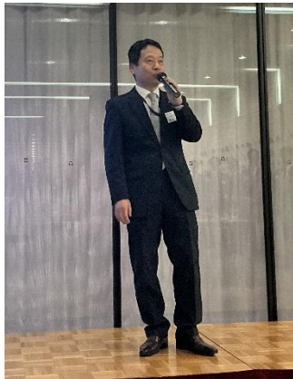
西上副本部長による閉会挨拶