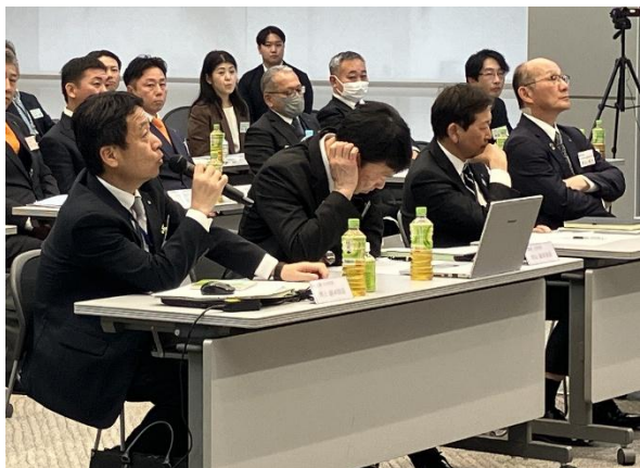
選考委員による質問