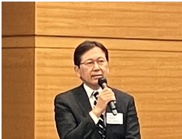
佐々木本部長による開会挨拶